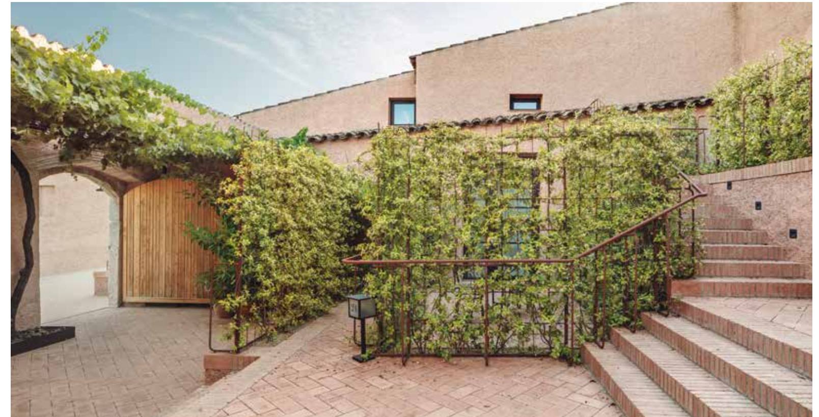
Terra Dominicata Hotel & Winery | Terra Dominicata Hotel & Winery

Localización Location: Morera del Montsant, Tarragona, Spain. Autores Authors: SCOB | Sergi Carulla, Óscar Blasco, arquitectos. Equipo Team: J. Lloret, O. Saro, S. Guerrero. Promotor Developer: Terra Dominicata Hotel & Winery. Constructora General Contractor: Drim Medi Ambient. Superficie construida Built area: 4.638m 2 . Fecha de finalización de la obra Completion date of the works: 2019.